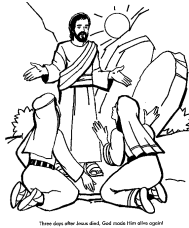
Tranh theo ảnh Jesus đã. God made Him alive again